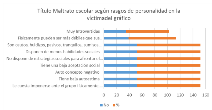
Gráfico 1. Maltrato escolar según rasgos de personalidad en la víctima